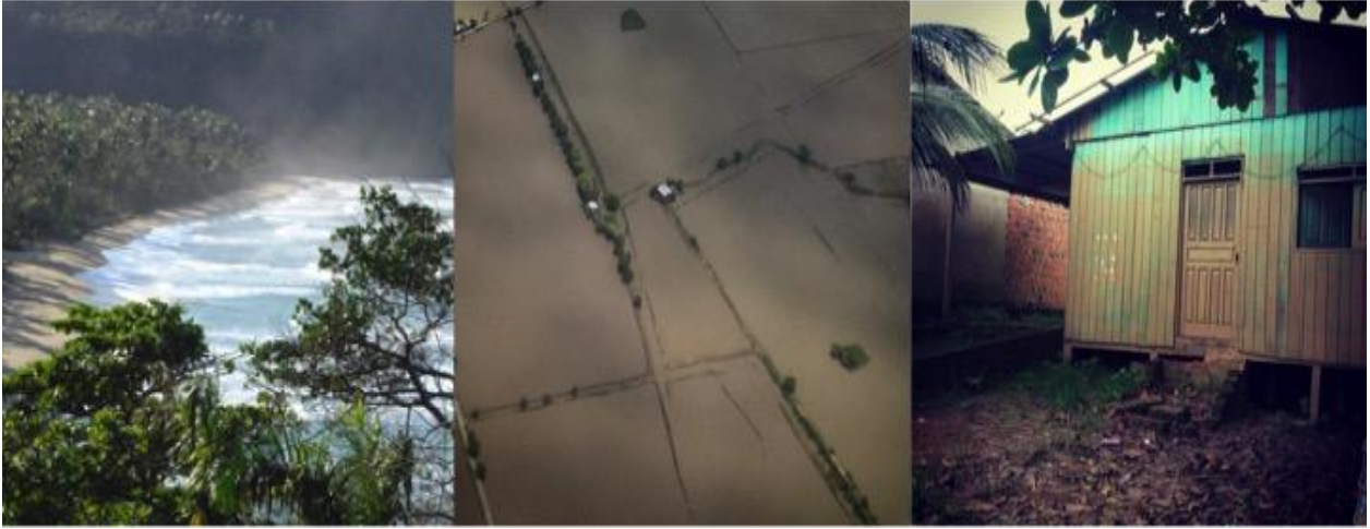
Figura 1: Inundaciones en las zonas de estudio

Notas: Izquierda: Terrenas , Península Samana en República Dominicana, donde las inundaciones son causadas por huracanes. Centro: Guayas , costa sur de Ecuador donde se encuentra Machala, donde ocurren inundaciones estacionales en zonas que fueron convertidas de manglares a camaroneeras. Derecha: Cobija , departamento de Pando, Amazonia Boliviana, casa con marca de agua por la inundación de febrero del 2015, resultado del crecimiento del río Acre de 15 a 18 metros.